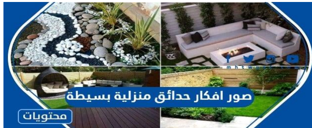
صور افكار حدائق منزلية بسيطة

(٣) اختيار النباتات والأشجار والشجيرات (نوع التربة . أنواع النباتات . الشمس . الرياح . حجم النبات )